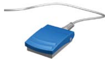
フットペダル 標準価格:¥28,000 ※2

※1 本品は、L型のユニット取付用ホルダーです。標準添付されているユニバーサルドッキングホルダーを設置できない場合のオプション部品です。