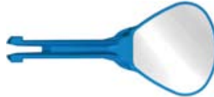
ミラーヘッド no.2 ミラー部 幅 : 18.2mm 長さ : 16.8mm