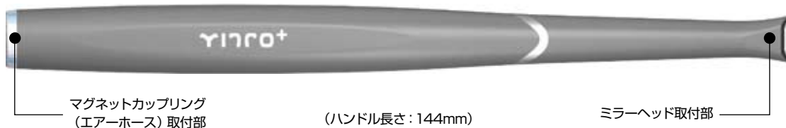
マグネットカップリング (エアアホース) 取付部

軽さはもちろんのこと、持ちやすさと重量バランスを考慮したミラーハンドル部。エアアホース取付部にはマグネット式を採用し、術中のミラー交換も簡単かつスピーディーに行うことができます。(写真はほぼ実物大)